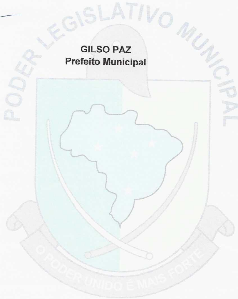
GILSO PAZ Prefeito Municipal

Gabinete do Prefeito Municipal, em 02 de janeiro de 2023.